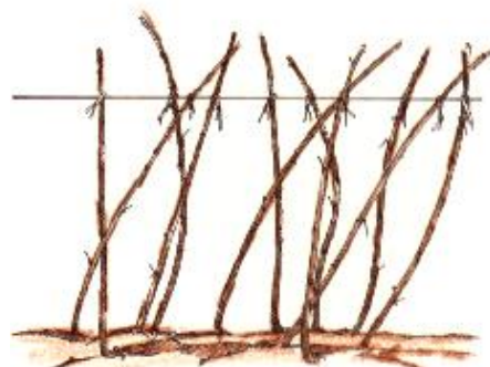
Éclaircissez les tiges restantes à 4 au pied