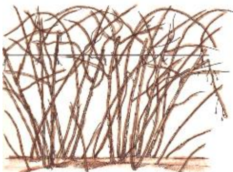
Taille des framboisiers

Multiplication : les framboisiers se multiplient par rejets de la talle. (suckers)